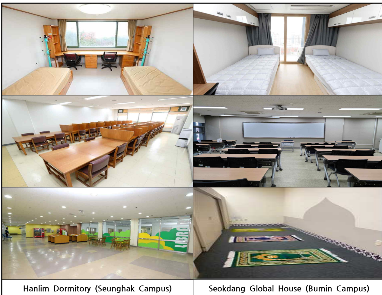
Hanlim Dormitory (Seunghak Campus)

※ For Seokdang Global House, the priority is given to the students who are taking Korean Language Course in Dong-A university. Furthermore, the room may not be available to the KGSP scholars due to the vacancy rate of the dorm.